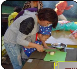
子供達もカレーの食材を準備